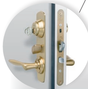
Assa 2000 Evo för ytterdörrar