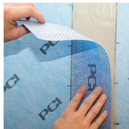
PCI Pecitape 100 P Band monteras över skarven i våtrumssystem VG2013

För tätning mot vattenledningsrör, avloppsrör och mot golvbrunn.