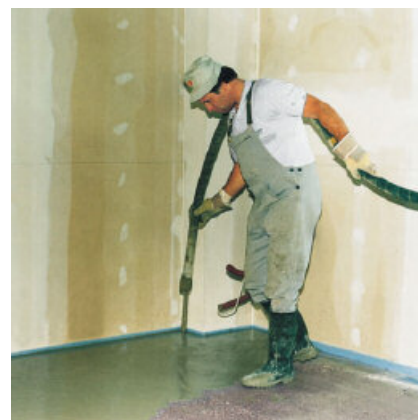
PCI Periplan CF 35 - en snabbtorkande avjämningsmassa för handspackling eller pumpning inomhus.