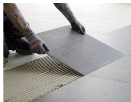
PCI FT Extra har en hög vidhäftning, plattorna fäster snabbt men kan ändå lätt justeras till rätt läge.