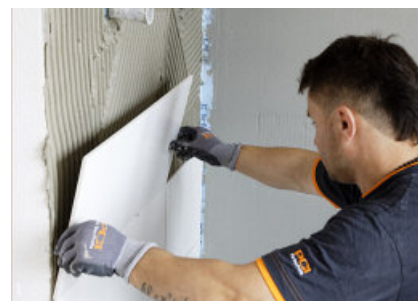
PCI FT Extra ger glidfri sättning, har bra "häng" som gör plattsättningen snabb och enkel.